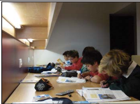
Sala de Estudio Solidario de Txindoki. ¡Más horas, más dinero!

El viernes aprovechando la fiesta hicimos un plan completo. Comenzamos con hora y media de estudio. Es verdad, 10 aguerridos txindotarras vinieron a las 12.00 a sacar unos euricos para la olimpiada solidaria. Así, poco a poco, nos hemos acercado a los 300 euros . No esta nada mal. Después una comida y poli-fútbol. Para rematar la tarde un buen partido en Ayete y las actividades de los viernes.