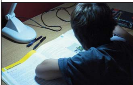
Rendimineto al máximo, 5h!!