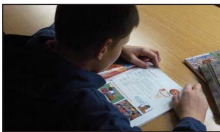
Mates, Lengua, Inglés...