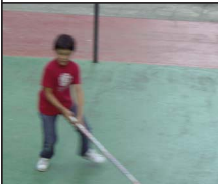
Pepe en uno de los "low-lights" del partido...